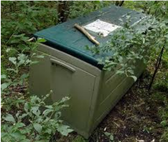
Auch so kann ein Cache aussehen...