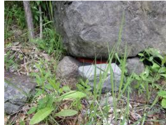
Wo versteckt er sich?